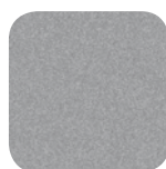
Aluzink AZ 185