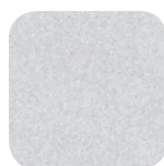
Silver RAL 9006