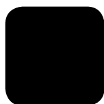
Svart RAL 9005